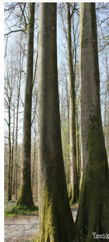
Les « jumeaux » en forêt de Fougères